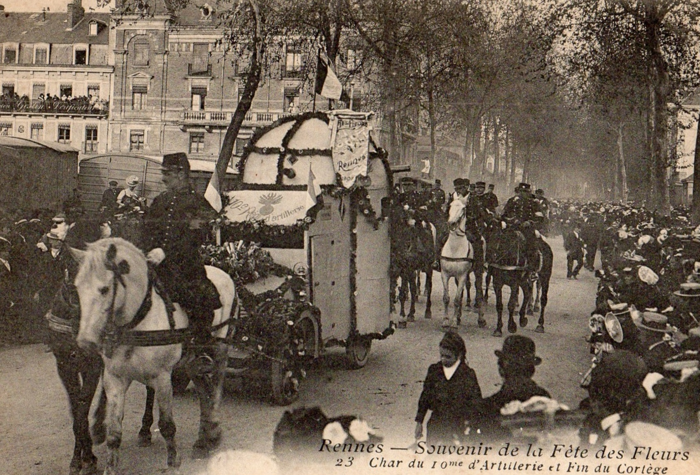
Rennes — Souvenir de la Fête des Fleurs 23 Char du 10 me d'Artillerie et Fin du Cortège